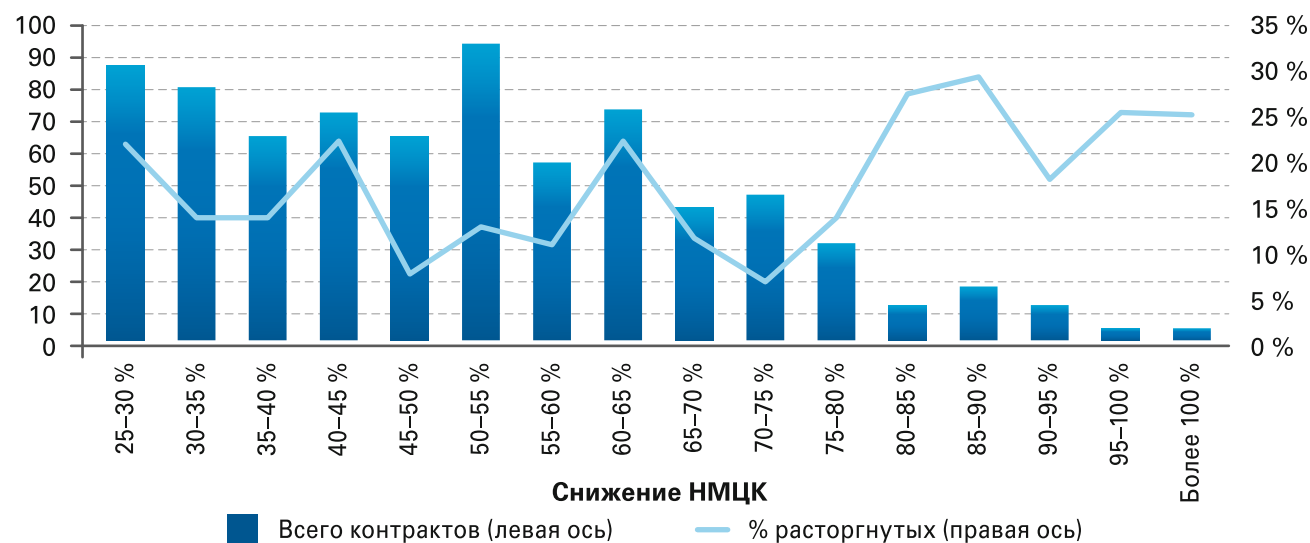
Рисунок 2. Частотный анализ контрактов на выполнение работ

При среднем числе 8 участников на одну закупку наблюдается высокое значение числа демпингующих участников. По мере увеличения заявок с ценой ниже 75 % от НМЦК снижается и цена контракта (рис. 3). В отдельных случаях число демпингующих поставщиков на одну закупочную процедуру достигало 12, а аукцион шел на право заключения контракта, что не несет в себе коммерческого смысла в разрезе рассматриваемого объекта закупки. Поскольку демпинг должен являться скорее исключением из нормальной практики, целесообразно разработать более эффективный механизм его идентификации.