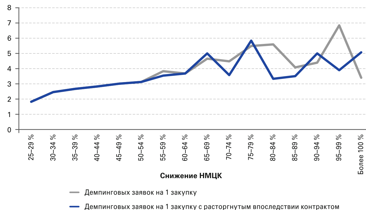
Рисунок 3. Среднее количество участников с демпинговыми заявками на закупку работ по сносу зданий и сооружений в 2015 году

Между тем отдельные заказчики при обосновании НМЦК на проведение работ по сносу зданий и сооружений применяли метод сопоставимых рыночных цен «в связи с осуществлением закупки выполненных работ, имеющей функционирующий рынок» 6 , что противоречит Методическим рекомендациям.