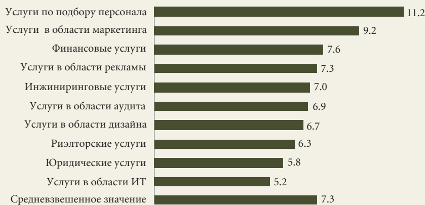
Рис. 1. Ожидавшийся в 2007 г. годовой рост продаж сектора интеллектуальных услуг в 2007–2010 гг. (%)

не вернется никогда, причем 7% — считают, что это «к сожалению», а 5% — «к счастью».