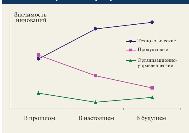
Рис. 2. Значимость различных видов инноваций для производителей интеллектуальных услуг в России: 2008