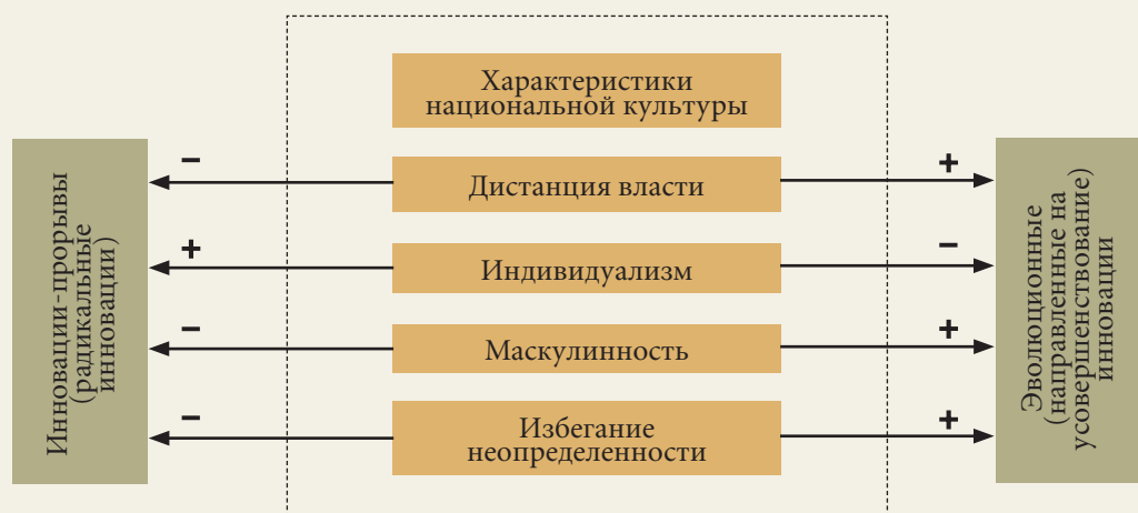
Рис. 3. Влияние национальной культуры на инновации

который производится исключительно на основе их квалификации и опыта. В результате в Россию едут специалисты, не знакомые с особенностями ведения бизнеса в стране. Они часто терпят неудачи из-за повседневных проблем, поскольку порой не могут понять мотивации поступков российских коллег. Их, в частности, удивляет, когда работник, прошедший долгое и дорогостоящее обучение, уходит от них к конкуренту из-за незначительной прибавки к зарплате.