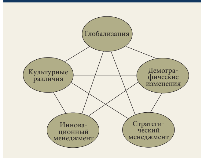
Рис. 2. Вызовы, с которыми столкнутся организации

впечатления от работы в российской компании одного немецкого менеджера, для которого «единственной возможностью не потерять надежду было вспоминать свои предыдущие удачи и ставить краткосрочные цели на день и на неделю» [Kessler, 1999].