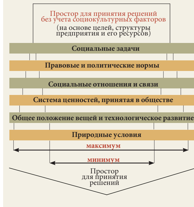
Рис. 1. Модель-фильтр принятия решений с учетом социокультурных факторов

интенсивность и ритм работы, отношение к трудовым обязанностям и карьере, сознательность и ответственность 1 . Между тем культурные различия не всегда принимаются во внимание при разработке бизнес-стратегий [Perlitz, 1994].