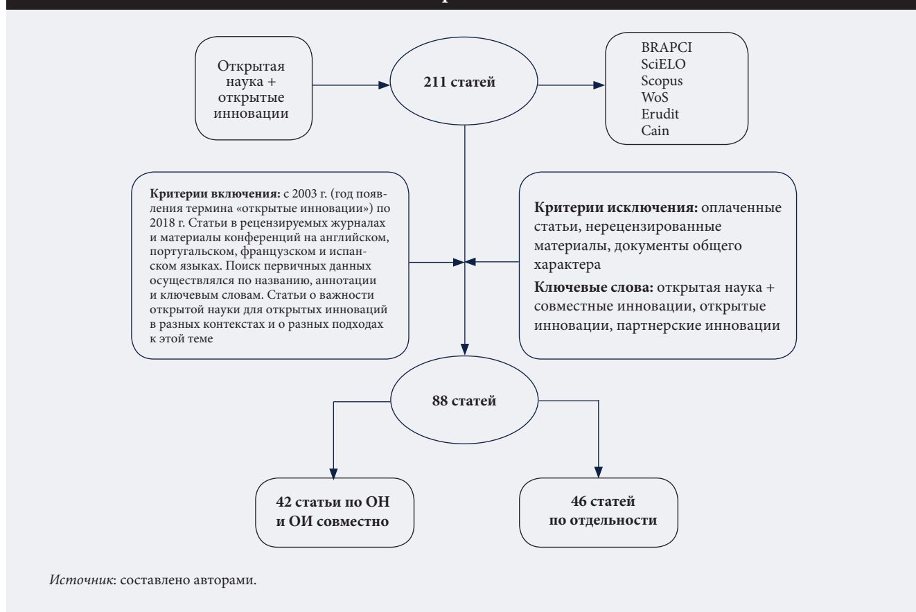
Рис. 1. Протокол СОЛ