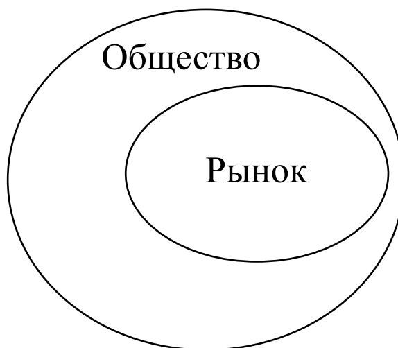
Рис. 2.2. «Укоренённая» точка зрения: рынок встроен в общество

ложением представляет собой сложную задачу. Очевидно, что проведение такого сравнения с точки зрения благосостояния по Вильфредо Парето невозможно, поскольку его структура основана на подходе, согласно которому рынок и общество — две отдельные сферы (см. рис. 2.1) 6 .