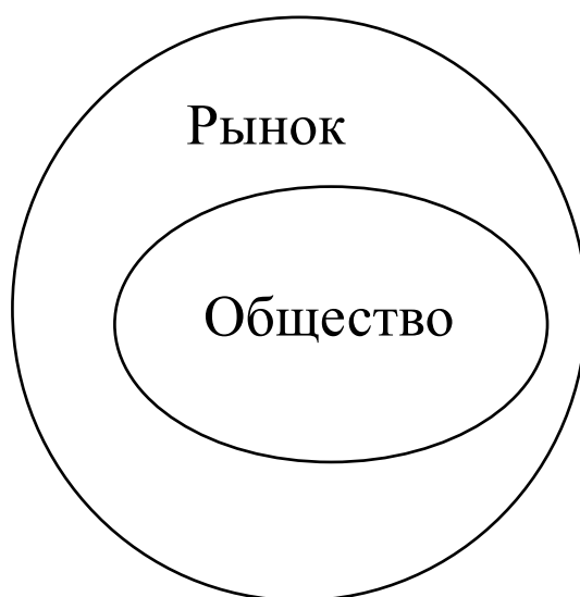
Рис. 2.3. «Примесная» точка зрения: общество в границах рынка

отношений рыночного типа между агентами [Hodgson 1999] 8 . По сравнению с двумя предыдущими подходами в данном случае имеет место принципиально иной взгляд на природу роста рынка. Используемые аргументы относятся не только к вторжению конкретных рынков в другие области общества, но к тому, как на них распространяется процесс формирования суждений рыночного типа и связанные с ним способы мышления и восприятия. По Джеффри Ходжсону и согласно другим авторам, такого рода экспансия возможна, но она ни в одном из случаев не способна полностью «затенить» все элементы общества в пределах рынка, не подвергая опасности саму себя. Даже тогда, когда Ходжсон не даёт точного определения «примесного состояния» и не указывает явным образом, к чему оно относится, мы понимаем, что присутствие «примесей» связано с мотивами акторов и их отношениями друг с другом. Как представляется, это соответствует точке зрения Ходжсона [Hodgson 1999].