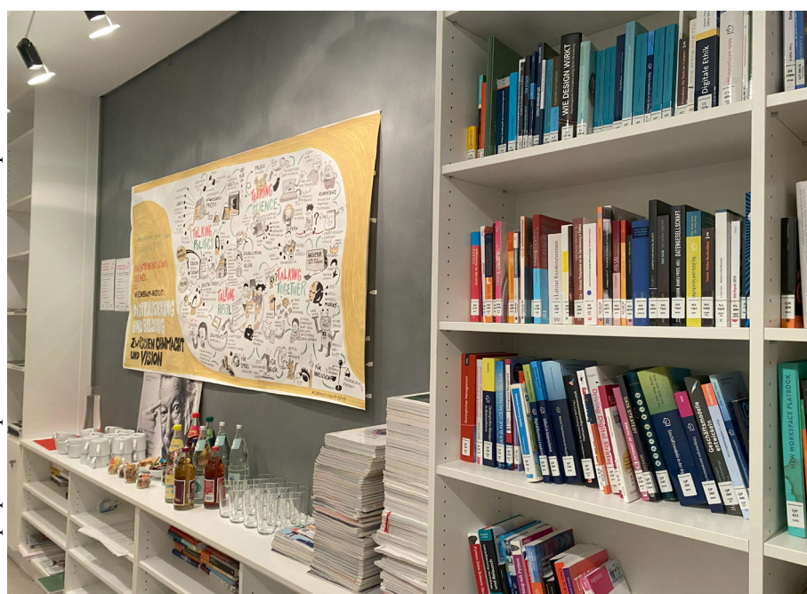
Рис. 2. Взгляд изнутри: рабочее пространство в Институте Вайценбаума

2025 г. 3 сентября