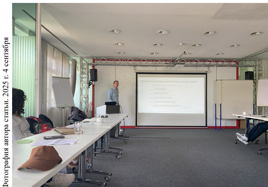
2025 г. 4 сентября

Второй день конференции был посвящён трансформациям в цифровой экономике, индустриальной политике и практиках ценностного регулирования. На утренних сессиях обсуждались рыночные изменения в сфере психического здоровья в Турции, роль цифровых технологий в восстановлении экономики Греции, а также новые формы удалённой работы и глобального трудового регулирования. После обеда участники обратились к темам налоговой политики, «зелёного перехода» и цифровых платёжных систем. Особый интерес вызвали дискуссии о санкциях и финансовых инфраструктурах в России, о восприятии экологической трансформации в среде так называемой «коричневой экономики», то есть в традиционной сырьевой экономике, и рыночных механизмах регулирования природопользования в сельском хозяйстве. На секции для молодых исследователей через призму дискурс-анализа обсуждались проекты о богатстве, инвестициях и финансовых рынках. Дискуссии этого дня позволили соединить фундаментальные теоретические вопросы с конкретными эмпирическими кейсами, что сделало обсуждение насыщенным и многоплановым.