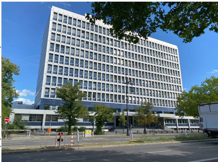
Рис. 1. Институт Вайценбаума

2025 г. 3 сентября