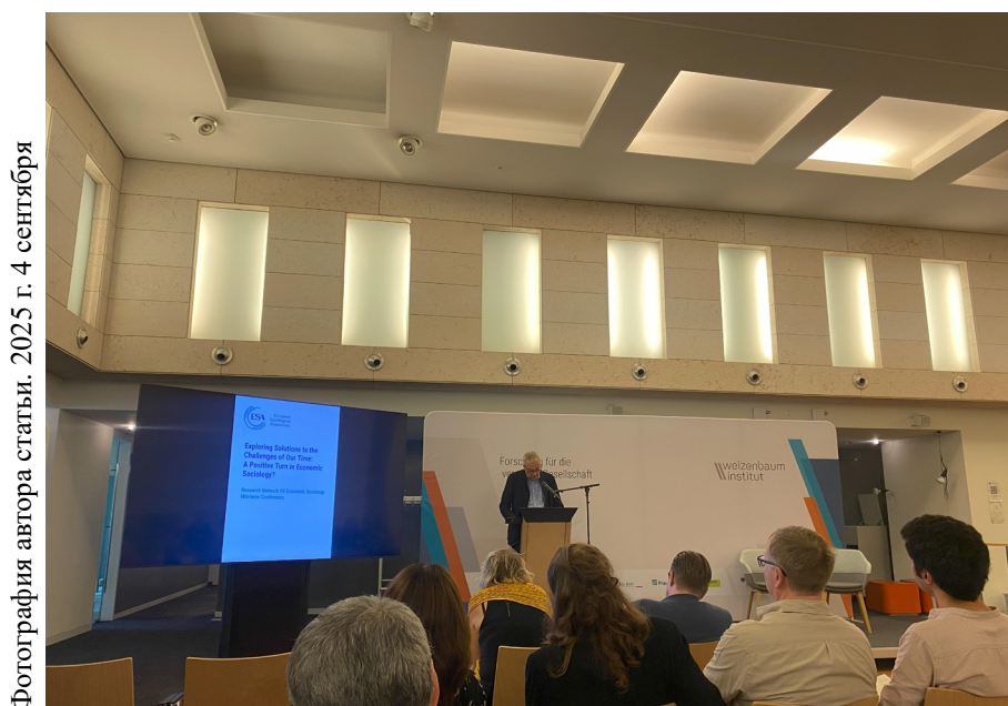
Фотография автора статьи. 2025 г. 4 сентября

При обсуждении доклада участники поднимали вопросы о том, как экономсоциологи могут влиять на публичные и политические дискуссии, где проходит граница между наукой и гражданской позицией исследователя. Обсуждение подчеркнуло актуальность поиска баланса между теоретическим наследием и новыми вызовами — от неравенства до климатических изменений. По мнению исследователей, экономическая социология должна быть открытой к смелым теоретическим поворотам, рождающимся в том числе в диалоге с активистами и обществом, то есть оставаться, как отметил Беккерт, динамическим проектом.