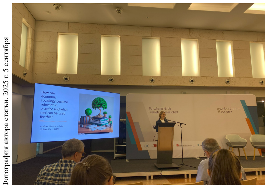
2025 г. 5 сентября

В дискуссии после выступления участники поднимали вопросы о том, кому служат наши исследования и как экономическая социология может сохранить баланс между теоретической глубиной и общественной значимостью. Обсуждение затронуло также роль классиков — М. Вебера, Г. Зиммеля, Э. Дюркгейма — и необходимость постоянной рефлексии над тем, что делает их работы актуальными для современности.