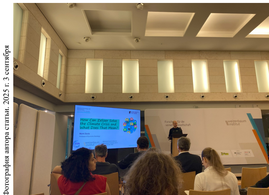
2025 г. 3 сентября

Доклад вызвал оживлённую дискуссию. По словам Йенса Беккерта, ценность предложенного подхода состоит в том, что он делает местные сообщества активными участниками борьбы с климатическим кризисом.