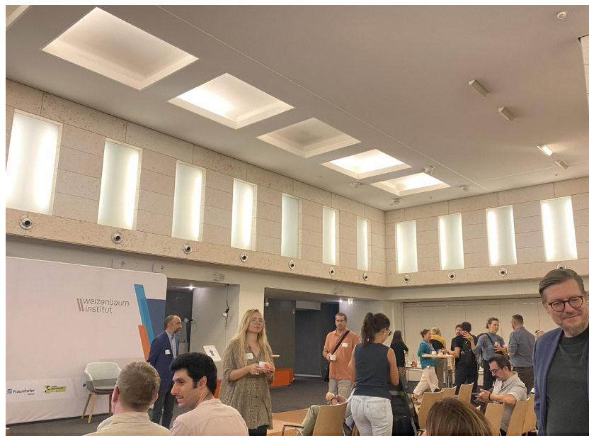
Рис. 8. Взгляд изнутри: кофе-брейк

2025 г. 5 сентября